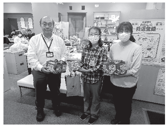
横須賀市福祉課へお届けしました。

当日は、時折晴れ間もあるうす曇りの空模様でしたが、温かい「芋煮」で心も体もほっこりとされたのではないのでしょうか?生産者さんと組合員さんの交流もあり、今回も楽しんでいただけました。