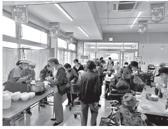
沢山の方々に食べていただきました。

多くの組合員さんに味わっていただきたいと作る量も昨年より多くしてはみたものの、1時間を待たずして終了。