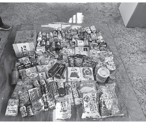
物価高の中ご協力ありがとうございました。現金支援もありました。(一面左下参照)

今回は最近の食料の値上げや米不足もありましたが、皆様のご協力で沢山の食品が集まりました。(寄贈報告は一面左下参照)