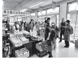
山形物産コーナー 漬物・軟白ネギ

当日は、時折晴れ間もあるうす曇りの空模様でしたが、温かい「芋煮」で心も体もほっこりとされたのではないのでしょうか?生産者さんと組合員さんの交流もあり、今回も楽しんでいただけました。