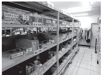
賞味期限と4種のグループに分けて棚へ仕付けます

別の職員の方が、分けられた食品の中から希望があった食品をピックアップしていただきました。来た食品は無駄になることなく、必要な施設などに送られていくそうです。企業からはパンや、冷凍食品の寄贈もあり、新しいロスを減らす取り組みも行われているそうです。