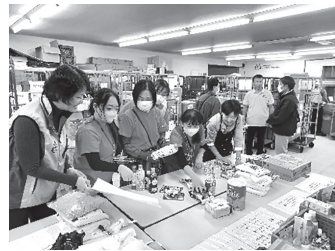
まずは4つの種類に分けます。主食・副食・嗜好品・飲料

別の職員の方が、分けられた食品の中から希望があった食品をピックアップしていただきました。来た食品は無駄になることなく、必要な施設などに送られていくそうです。企業からはパンや、冷凍食品の寄贈もあり、新しいロスを減らす取り組みも行われているそうです。