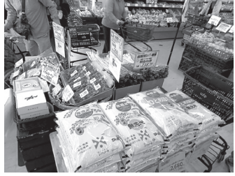
今年もおいしいお米「つや姫」できました。

昨年同様猛暑により心配だったが、今年は雨が降ってくれたので良かった。ただ、降りすぎて(一部)ダメになってしまった田んぼもあったが頑張っておいしいお米を作りました。一生懸命作ったので、たくさん食べてください!